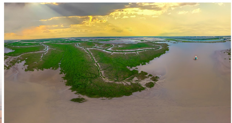
海上漂来一点绿