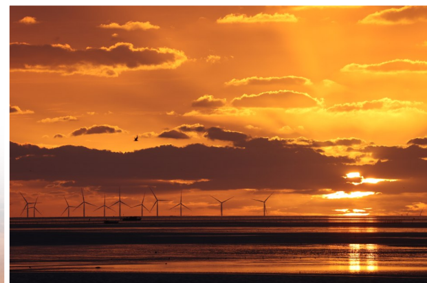
晨曦初照