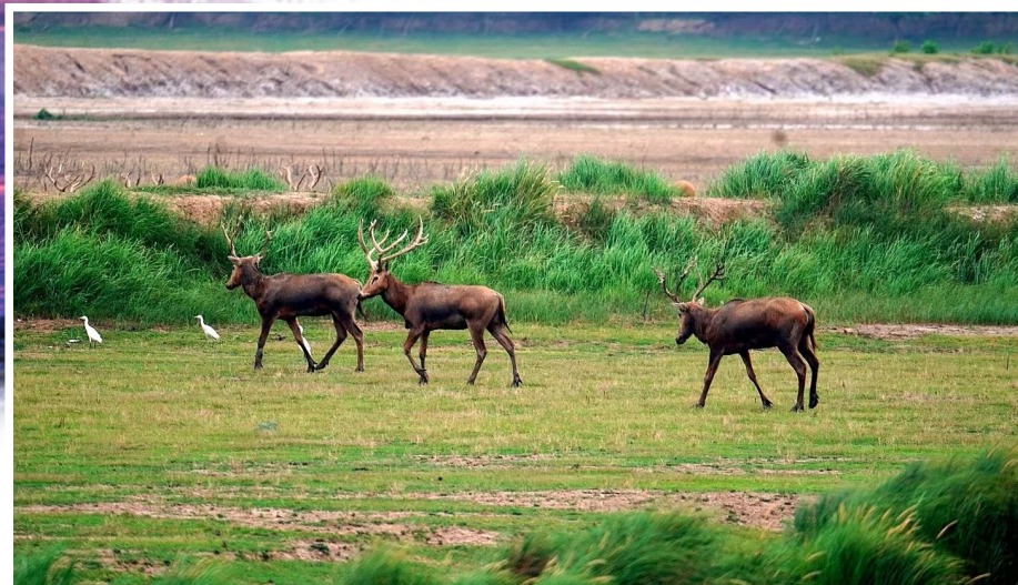
闲庭信步