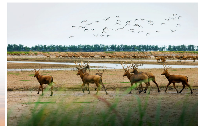
行走野鹿荡