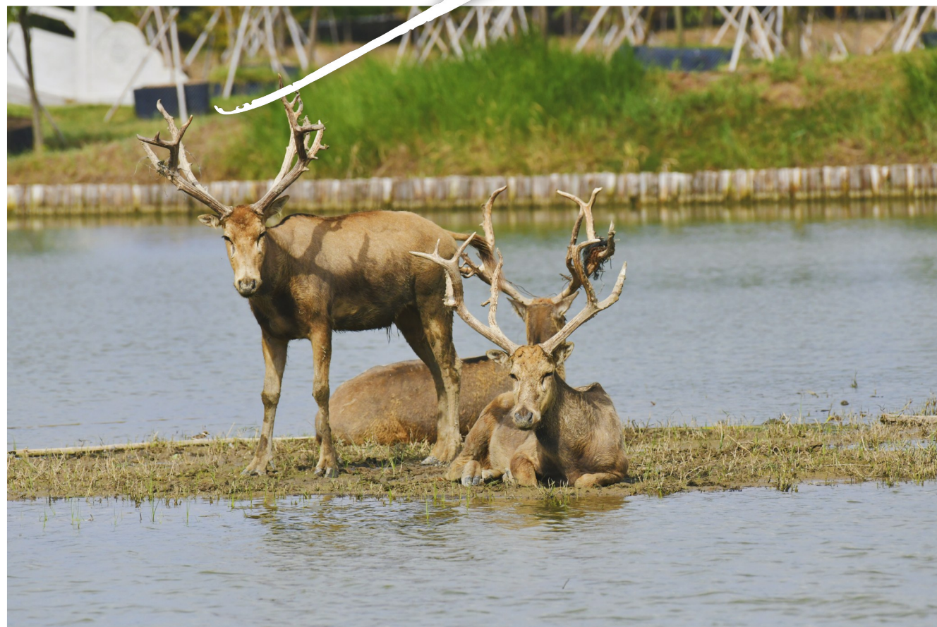
悠然自得