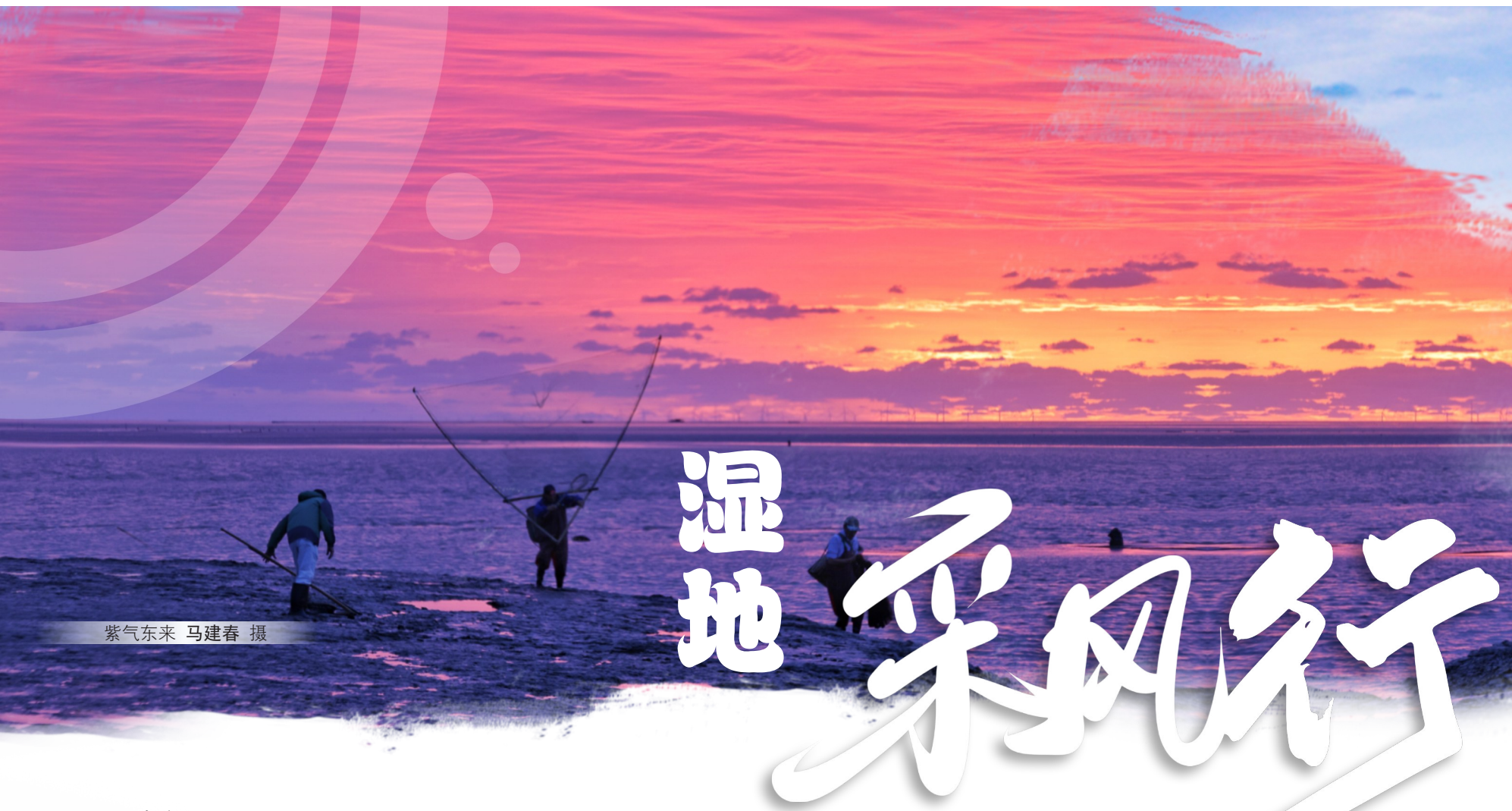
紫气东来