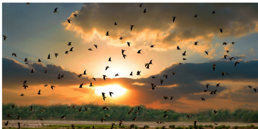
群鸟飞翔