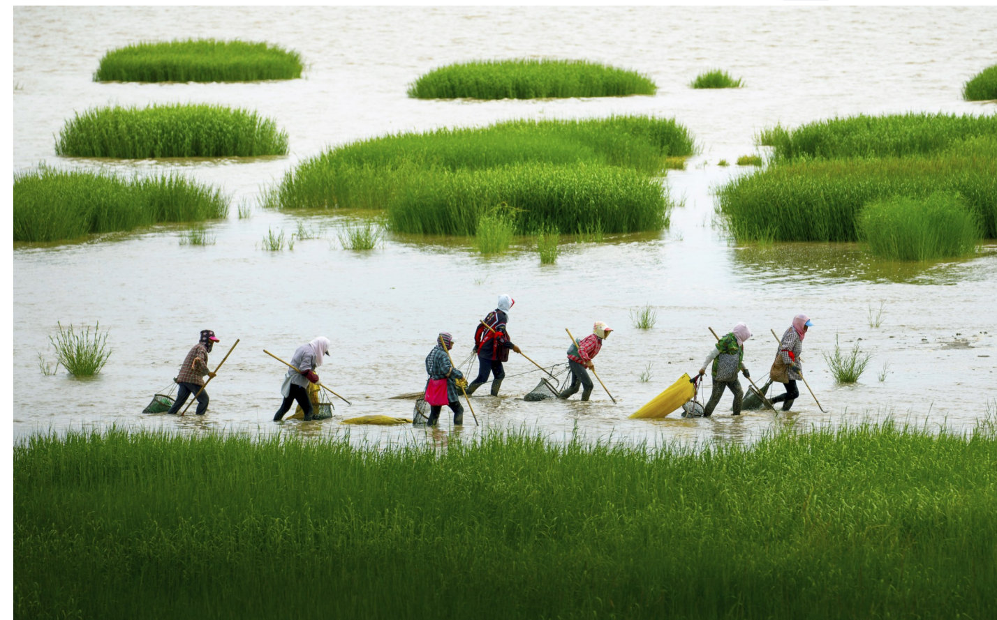
赶海归来