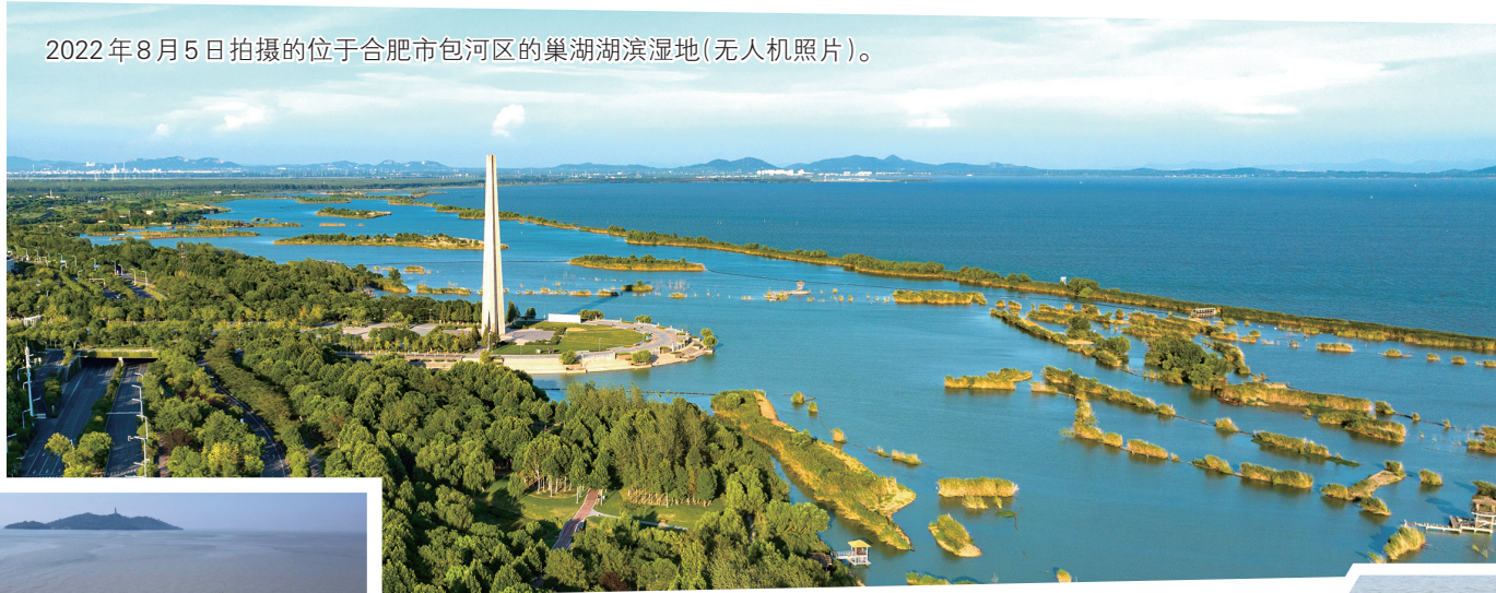
2022年8月5日拍摄的位于合肥市包河区的巢湖湖滨湿地(无人机照片)。