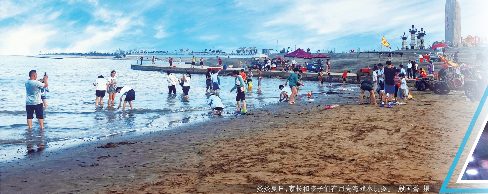
炎炎夏日,家长和孩子们在月亮湾戏水玩耍。