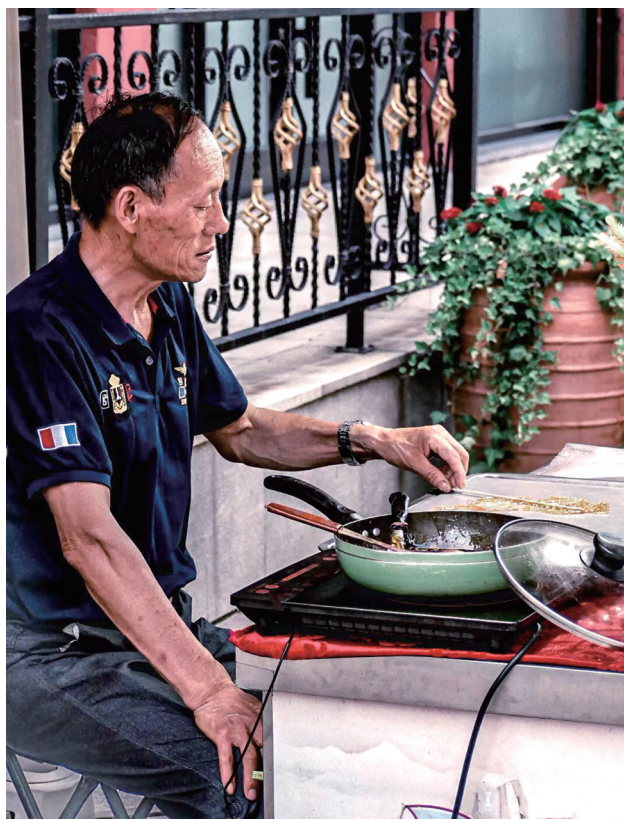
夏日炎热,糖人师傅气定神闲。