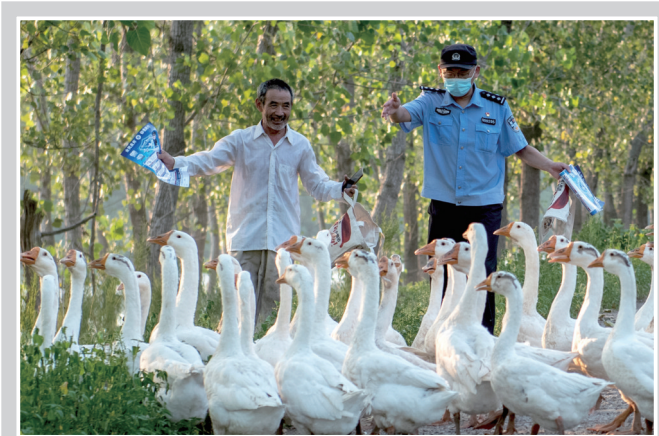
8月14日,东台城北派出所民警到乡间开展普法宣传并帮老人放鹅。