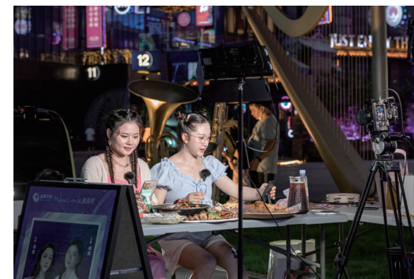
新弄里直播热闹非凡。