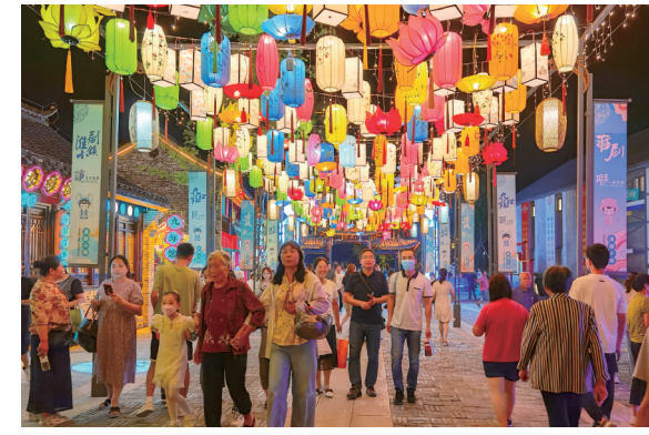
夏夜,淮剧小镇灯火通明。