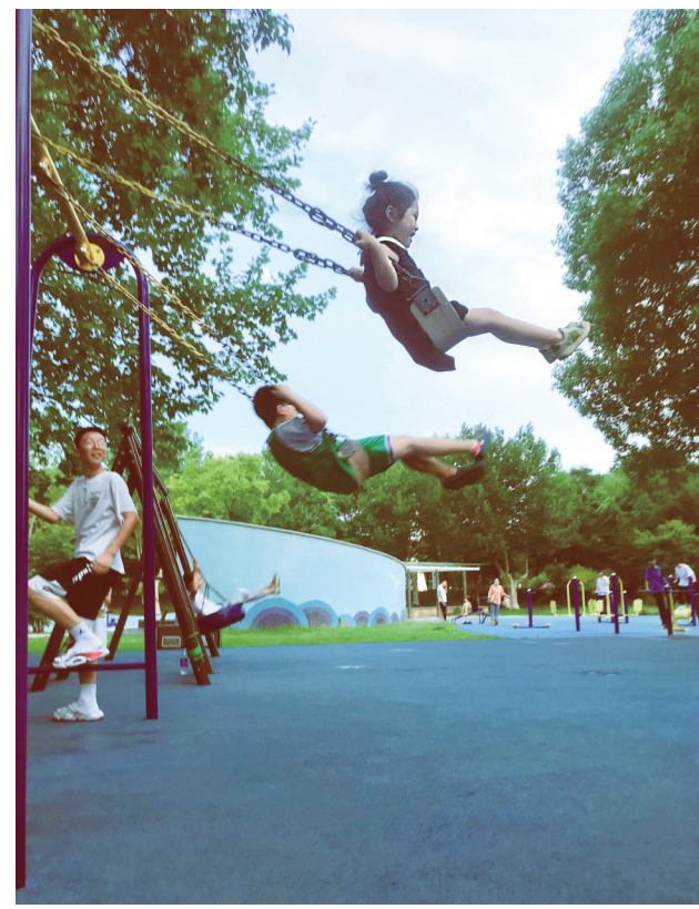
荡起秋千试比高。