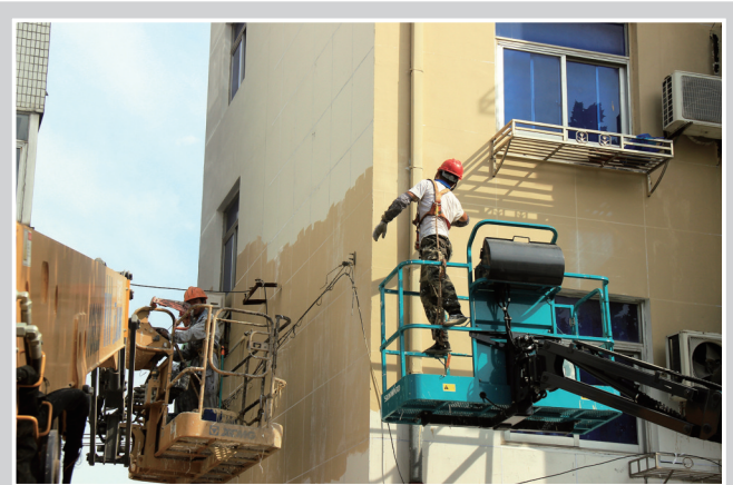
8月13日,新洋农场工人冒着高温对街道外墙进行翻新。