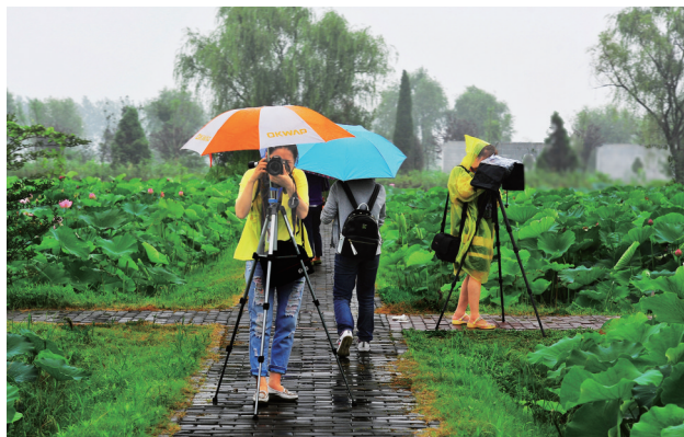
水烟荷塘有清凉。