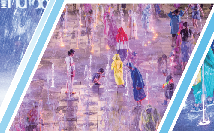
孩子们在市区新弄里喷泉广场戏水消暑。