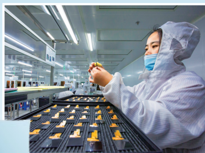
精心装配