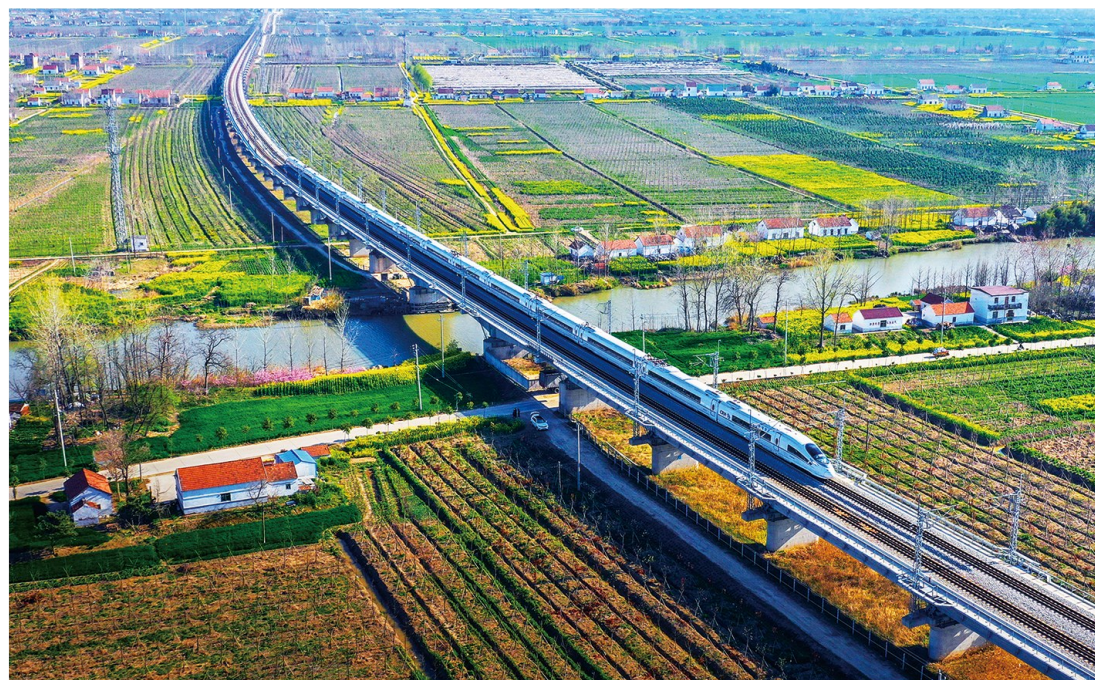
高铁到我家