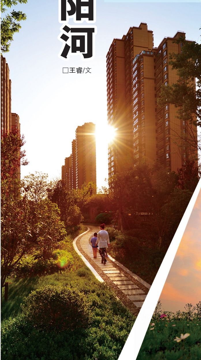
生态小区