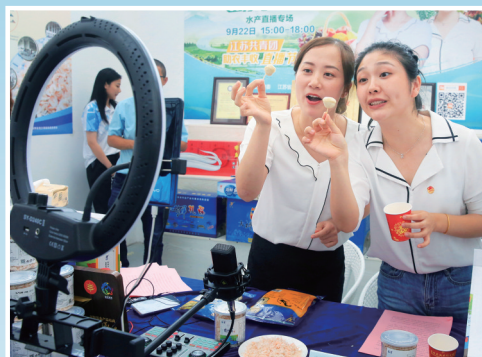
网上销售成时尚

投稿邮箱:yfdzbyx@126.com 《影像盐城》编辑部 联系电话:15051089688 陈先生。