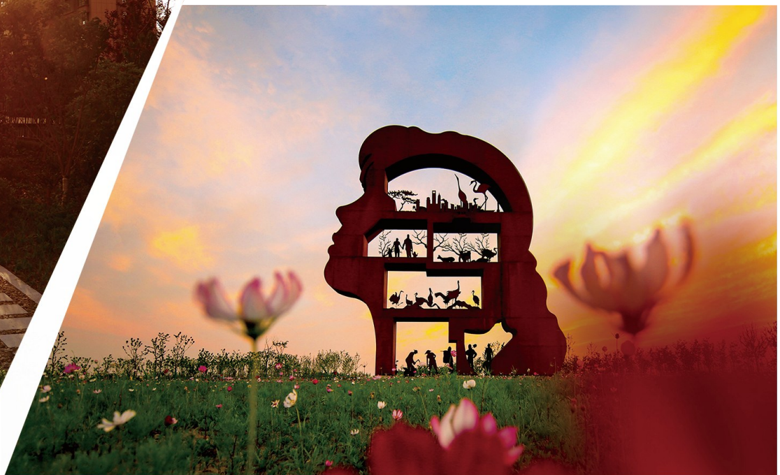
光遇日月岛