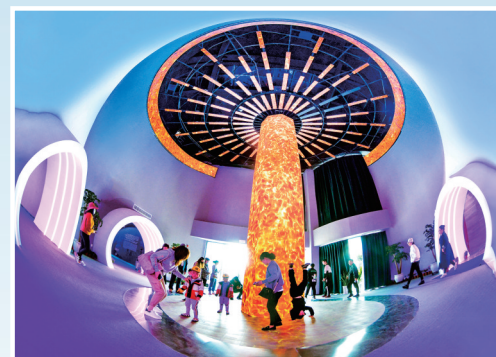
奇妙空间