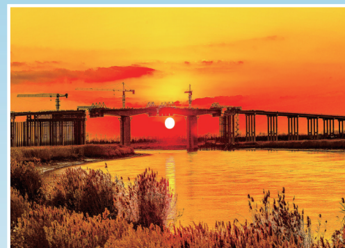
黄金水岸