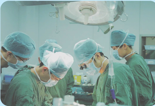
10年前的手术现场。