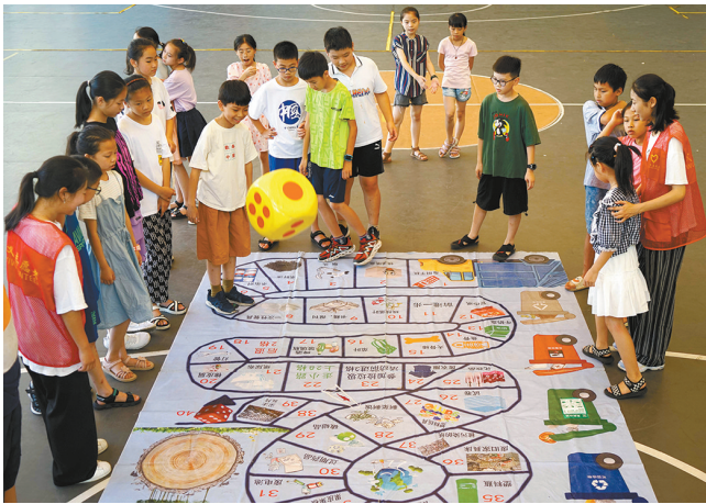
7月27日,外来务工人员子女暑期托管班的小朋友在浙江省武义县青少年宫玩垃圾分类棋。暑假期间,孩子们参加丰富多彩的活动,乐享假期生活。