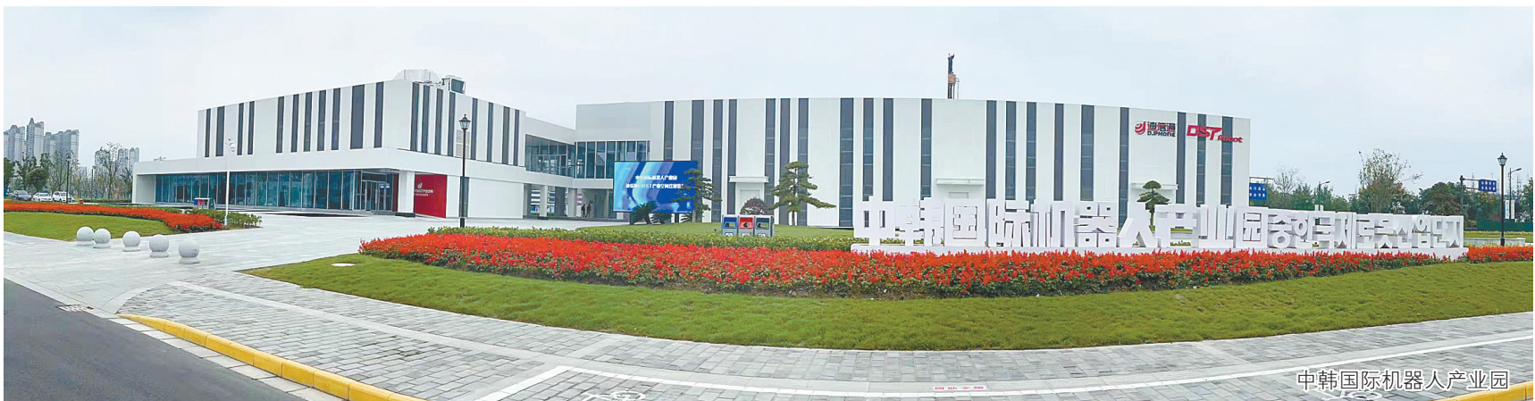
中韩国际机器人产业园