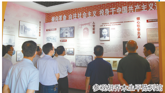
参观胡乔木生平陈列馆