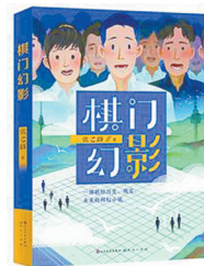
版本:天天出版社 作者:张之路 《棋门幻影》