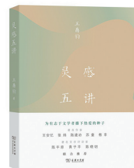
版本:商务印书馆 作者:王鼎钧 《灵感五讲》