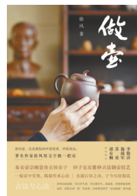
版本:江苏凤凰文艺出版社 作者:徐凤 《做壶》