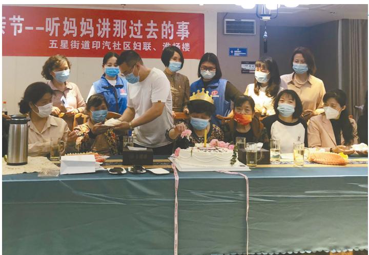
5月6日上午,亭湖区五星街道印汽社区妇联联合辖区爱心企业、位于市区文港路的淮扬楼,开展“感恩母亲节——听妈妈讲那过去的事”活动,共庆欢度母亲节,倡导温馨和谐平等健康的文明家庭,努力营造感恩母亲、尊重母亲、热爱母亲的良好氛围。