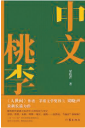
版本: 作家出版社 作者: 梁晓声 《中文桃李》