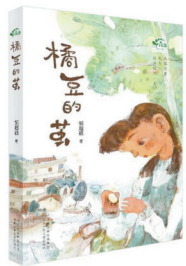
版本: 河北少年儿童出版社 作者: 邹超颖 《橘豆的茧》

本书追踪了1400年到1800年四个世纪以来多个欧洲国家的新闻史,展示了控制新闻的力量,新闻在政治、宗教改革和社会事件中的角色,新闻的娱乐性和时效性,记者的可信度,以及人们在推开新闻的世界之窗后发生的改变。今天,在一个被信息淹没的时代,人们如何在这种信息规模中相互沟通?读者或将在书中得到新的思考。 徐舒薇