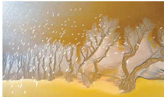
沙洲物语