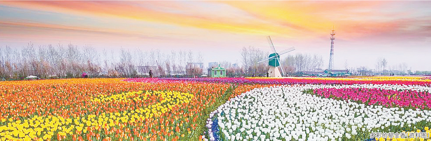
多彩的郁金香(资料图)