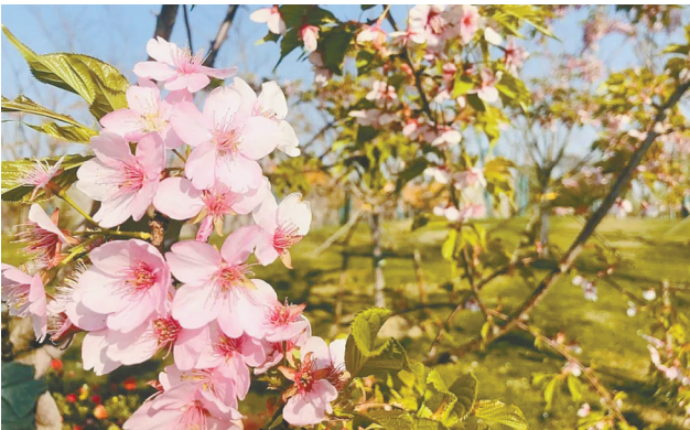
浪漫的樱花(资料图)

黄海森林公园(二月兰) 龙冈桃园(桃花) 梅花湾(梅花) 黄尖牡丹园(牡丹) 恒北村(梨花)