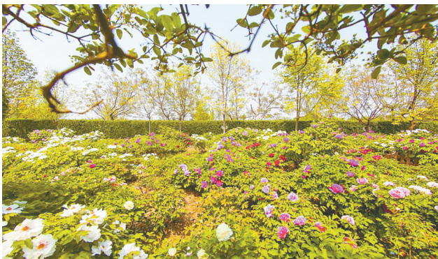
雍容的牡丹(资料图)