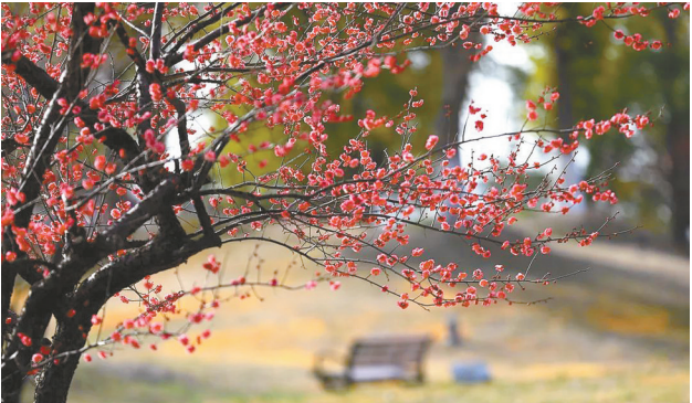
傲然的梅花(资料图)