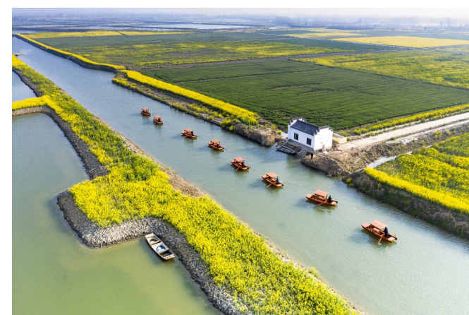
水乡春色