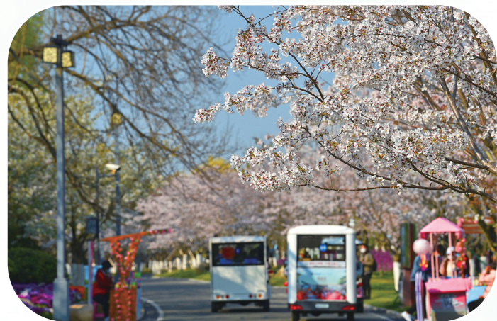
樱花盛开

四月,是风的季节,是花的盛宴,淋漓尽致地挥洒着春天的清新和美好,鼓荡着人们梦想的风筝高高飞翔,尽情享受那一场场世间的视觉盛宴……只要你用心,你会发现四月天的盐城,美丽就在那里,妩媚了世界,温柔了岁月,惊艳了所有人的眼眸。