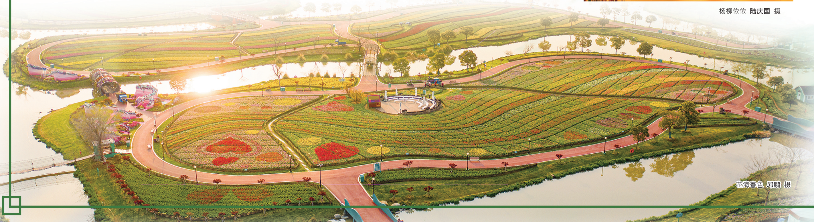
花海春色