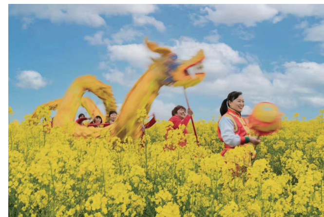
春风十里菜花开