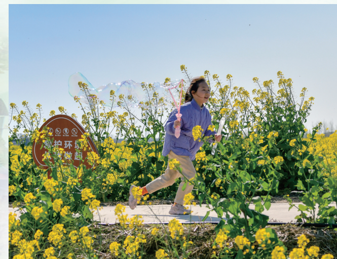
我与春天有个约会