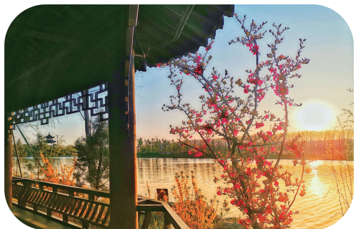
在水一方观春景