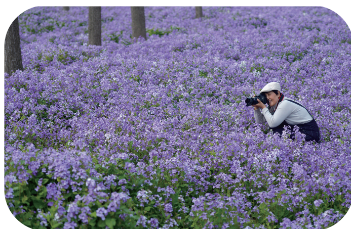
用镜头留住美好