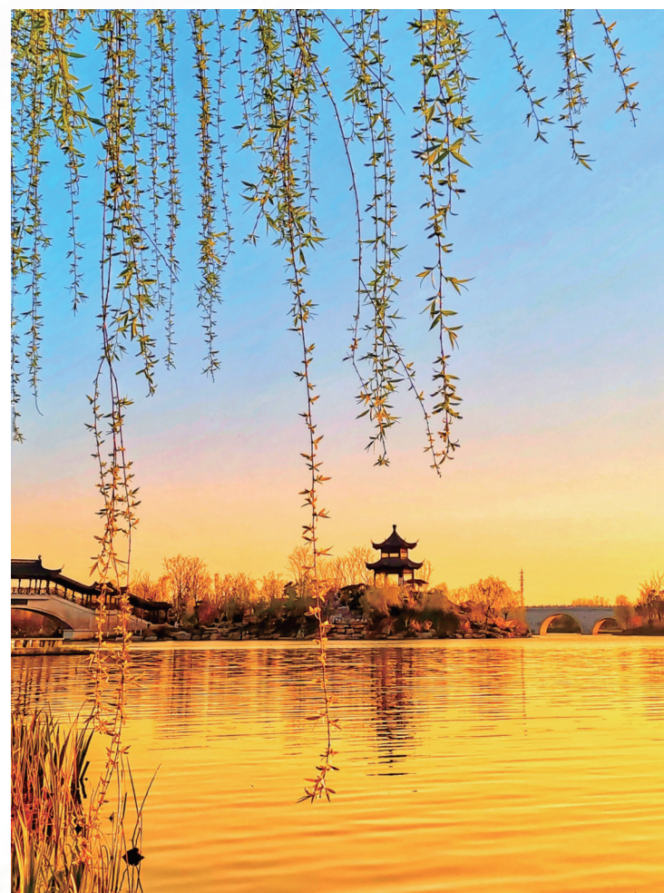
杨柳依依