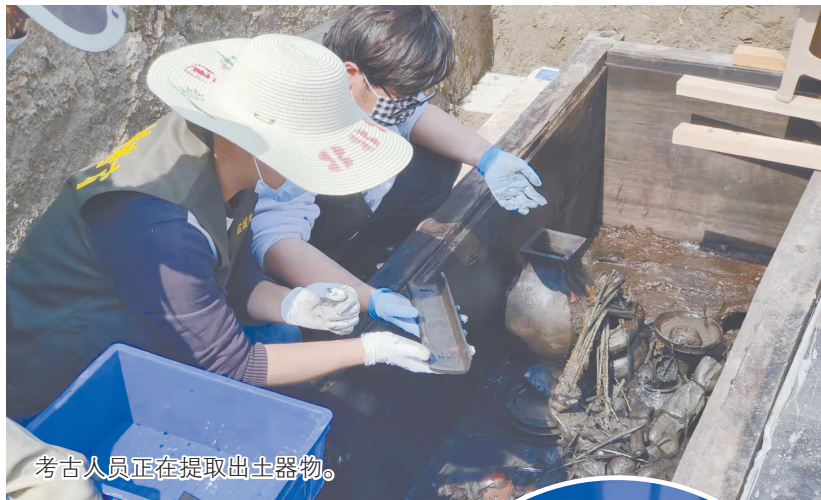
考古人员正在提取出土器物。