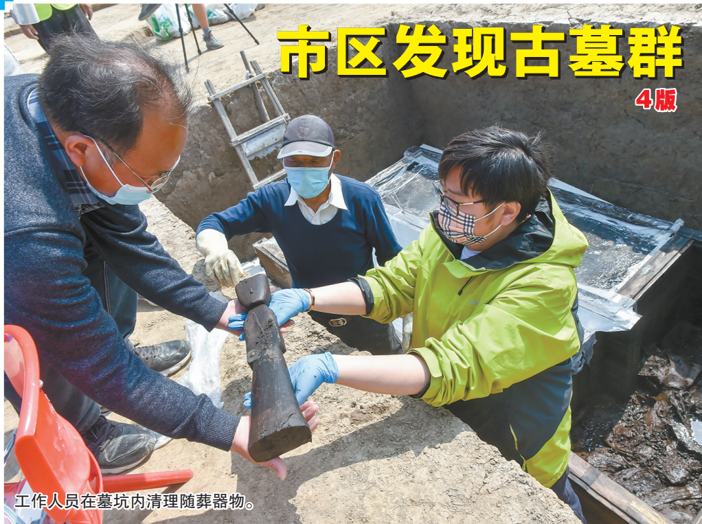
工作人员在墓坑内清理随葬器物。

4月6日上午,工作人员在盐城市亭湖区五星街道东闸新村考古发掘工地清理一座西汉早期墓葬。墓葬保存情况良好,等级较高,实属罕见。记者从发掘现场了解到,该地块共发现有近300座古墓,以明清时期为主,也是迄今为止盐城市区发现的最大古墓群,镇江博物馆和盐城市博物馆考古工作人员正在进行抢救性发掘。当天上午从墓坑内清理出陶罐、木俑、漆耳杯、陶钫、缴、漆瑟、弩机、弓、瓢等近百件(套)器物,其中完整木弩机、陶郢爱、弓箭、漆六博棋盘等在盐城都是首次发现。在西北部还有一座相对较小的汉墓,出土近30件随葬品。器物提取之后,还将对主棺进行清理,并结合本次发掘成果,对盐城汉墓进一步深入研究。本次发现对研究盐城地区汉代社会、经济、生活情况等都有着重要意义,目前墓葬清理发掘工作仍在进行。