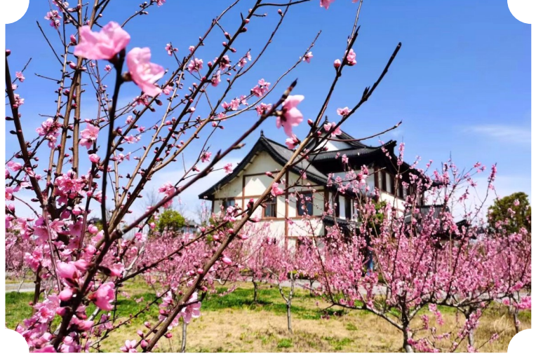
桃花吟 林黛 摄