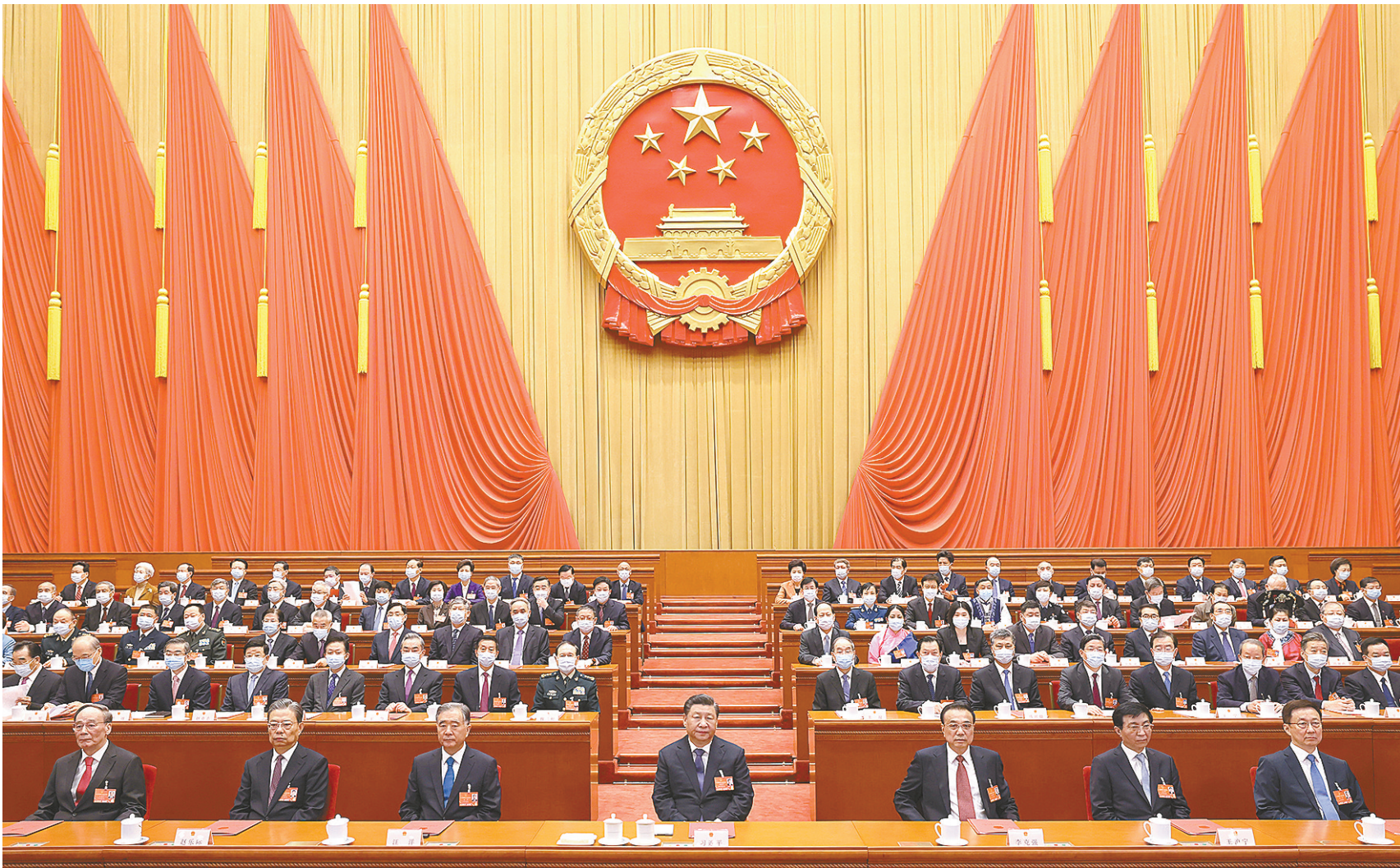
3月11日,第十三届全国人民代表大会第五次会议在北京人民大会堂闭幕。党和国家领导人习近平、李克强、汪洋、王沪宁、赵乐际、韩正、王岐山等在主席台就座,栗战书主持闭幕会并发表讲话。

批准政府工作报告、全国人大常委会工作报告等 通过关于修改地方组织法的决定 习近平签署主席令予以公布 通过关于十四届全国人大代表名额和选举问题的决定等 习近平李克强汪洋王沪宁赵乐际韩正王岐山等在主席台就座 栗战书主持并讲话