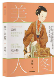
版本:中信出版集团 作者:孟晖 《美人图》

《花都开好了》写的是开花植物,是一幅四时赏花路线图,是一本以月令为纲介绍开花植物的生活美学之书。在春温、夏暑、秋凉、冬寒四时变化中,呈现花朵的生长之姿,从四时花朵延伸到自然节律、风物习俗、古今诗话,倡导读者遵循大地的生息节奏,感受花朵之美以及蕴含其中的植物文化。本书以月令为纲依次选出杏花、梅花、茶花、桃花、樱花、兰花等36种时令之花。淑惠