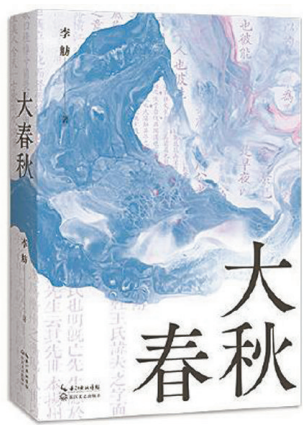
《大春秋》 作者:李舫 版本:长江文艺出版社

李舫是学者、作家、文艺评论家,她的作品不乏阅读之外的深度思考。与已经出版的《不安的缪斯》《在响雷中炸响》《纸上乾坤》等文化代表作相比,其最新作品集《大春秋》多了历史的厚重。在恢弘浩荡而又沉郁深厚的历史与文化场域中,作者漂泊、寻觅、思索、叩问,眷念、批判、热爱、忧戚,酣畅淋漓地书写了一幅磅礴丰沛、蕴思深刻、充满传奇与智慧的大历史大文化景观。这是作者的一次文化冒险,也是一份历史笔记。