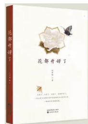
版本:沈阳出版社 作者:刘学刚 《花都开好了》