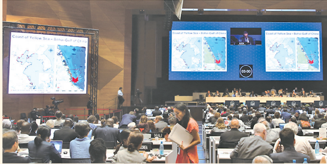
中国黄(渤)海候鸟栖息地(第一期)审议现场