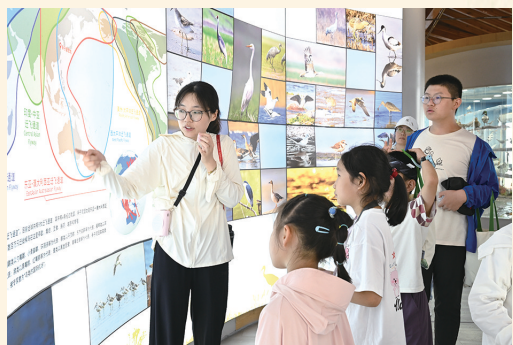
参观黄海湿地博物馆

亲爱的黄海湿地,7岁只是一个节点,对于拥有亿万年历史的你来说,7年不过是沧海一粟,但对于我们来说,这是一个全新的开始。未来的日子里,我们将持续推进生态保护与修复,让你在气候变化中更有韧性;继续开展遗产地监测,为科学保护与管理提供科学依据;我们还将把你的故事