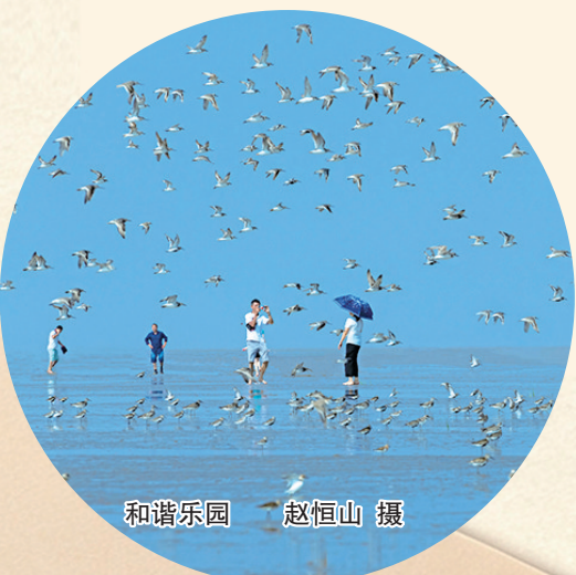
和谐乐园

这七年,在我们的共同努力下,因你而诞生的“黄(渤)海湿地国际会议”,升格成为全球滨海论坛,作为论坛永久举办地,盐城成功举办了首届全球滨海论坛,发布了《盐城共识》等成果,向世界发出了“盐城声音”。盐城,变成了全球滨海生态保护合作与交流的核心窗口,越来越多的国际目光在这里汇聚,越来越多的生态保护经验从这里走向世界。