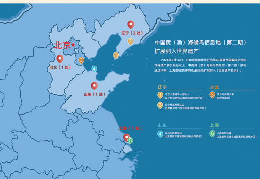
中国黄(渤)海候鸟栖息地(第二期)扩展列入世界遗产

这七年,我们一起经历了很多。 你的家族壮大了——2024年,中国黄(渤)海候鸟栖息地(第二期)上海崇明东滩、山东东营黄河口、河北沧州南大港、辽宁大连蛇岛-老铁山和辽宁丹东鸭绿江口五处提名地,作为你的边界拓展,被列入《世界遗产名录》。