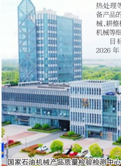
国家石油机械产品质量检验检测中心

1300亿元,规模以上企业达1600家,省级以上专精特新企业突破600家。围绕石油石化装备、农机及工程机械、电力电气设备、机床及基础制造装备、纺织轻工装备等七大领域,推动基础工艺向精准化绿色化转型、基础件向高端化稳定化跃升。新兴领域,加速布局。机器人产业做大做强“2+4+N”产品体系,江苏盐海电镀中心全力构建服务高端装备制造的金属表面处理配套高地。船舶海工装备依托黄海新区岸线资源,实现大型货轮和豪华邮轮制造零的突破,产业规模突破100亿元。低空装备抢抓发展机遇,布局无人机、eVTOL等,产业规模突破50亿元。重点工程,扎实推进。产业发展提质工程引导各地聚焦1至2个细分领域,提升建湖石油机械国家级质检中心、滨海绿岛智造服务中心、盐城CNC产能共享平台等功能。新增专精特新企业100家以上,年建成先进级智能工厂10个、省级以上绿色工厂10家。