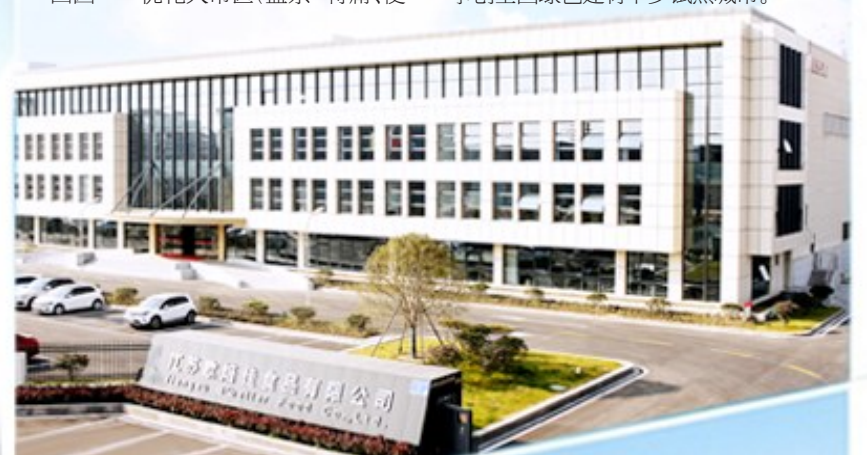
江苏欧焙佳食品有限公司

“四园两翼多点”布局加快构建。四园——优化大市区(盐东-特庸、便仓、张庄)建材产业园、阜宁绿色智慧建筑产业园基础设施。两翼——完善东台、滨海建材产业园建设,增强南北辐射能力。多点——围绕隔热保温材料、特种玻璃、特种陶瓷等产业多点布局。