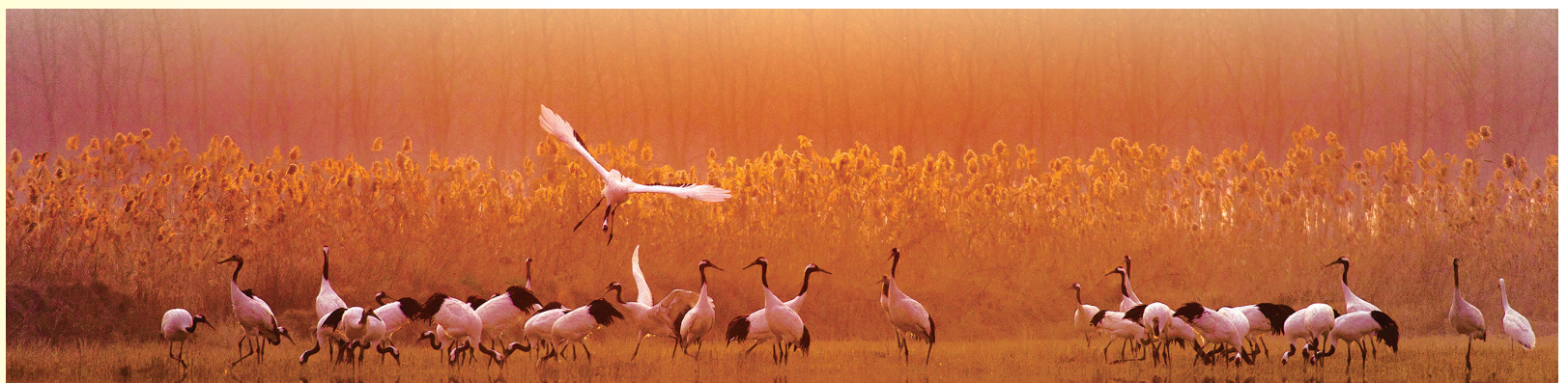
盐城珍稀保护区风景如画