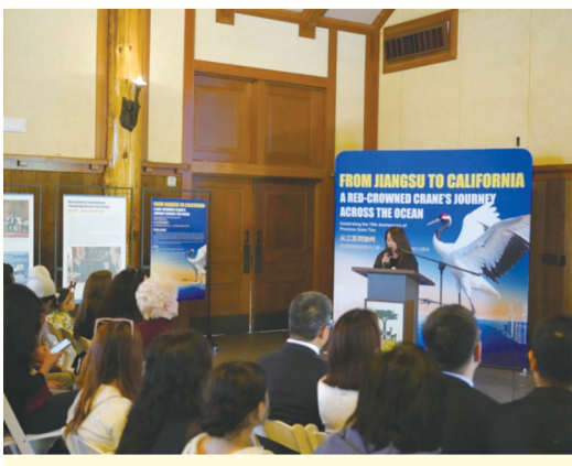
“从江苏到加州:丹顶鹤使者的跨洋之旅”人文交流活动在美国旧金山动物园拉开帷幕

活动现场,江苏盐城湿地珍禽国家级自然保护区与旧金山动物园共同签署生态合作备忘录。双方在珍稀物种保护与生态管护领域各有所长、优势互补,未来将围绕丹顶鹤、沙丘鹤等重点物