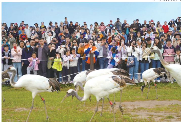
丹顶鹤湿地生态旅游区

此前,燕舞集团举办的“鹿王伉俪”活动入围名单已公布。“鹿王”伉俪入围名单公布,快来沾喜气啦!