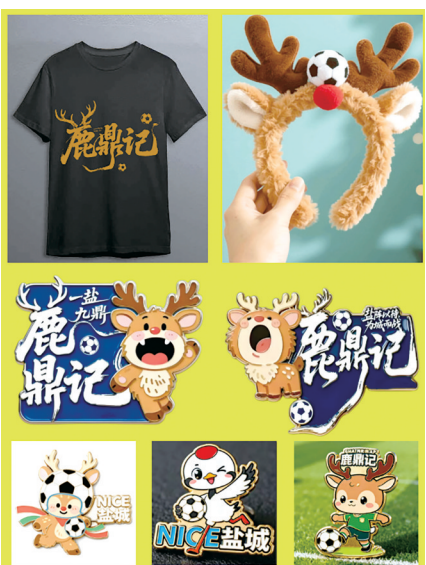
“苏超文创”系列产品

燕舞集团紧抓盐超赛事热点,推出以盐城特色麋鹿文化为核心的“鹿鼎记”——苏超文创”系列产品。该系列涵盖麋鹿玩偶、麋鹿发箍、麋鹿钥匙扣等多款文创单品,将苏超赛事的超高热度与盐城湿地文化符号深度融合。凭借憨态可掬的萌趣形象,系列产品迅速引爆社交平台,成为年轻群体竞相追捧的文化潮品。