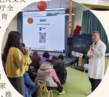
“五健”护航成长 健康科普进校园系列活动