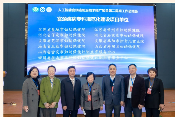
2025年获中国妇幼保健协会“人工智能宫颈癌防治技术推广项目优秀项目单位”等荣誉

防线,深化“无红包”医院创建;守牢医疗质量底线,严格执行18项核心制度;夯实后勤服务保障,推进节能降耗与智慧计量;织密安全防护网络,强化医警联动与应急演练;加速智慧医院建设,探索“AI+妇幼保健”新模式。五大保障协同发力,为医院行稳致远保驾护航。