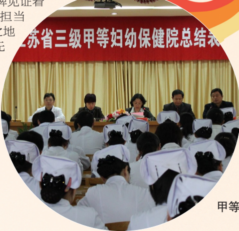
2010年创成三级甲等妇幼保健院