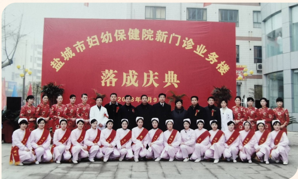
新门诊业务楼落成

时间回溯到1986年6月。盐城市亭湖区毓龙西路34号,一座坐北朝南的四层小楼,第一代妇幼人怀揣着守护盐阜妇幼健康的初心,郑重挂起“盐城市妇幼保健院”的牌子。彼时妇科、产科仅设18张病床,没有先进诊疗设备,全靠医护人员的仁心与双手撑起诊疗工作。就是在这样艰苦的条件下,他们扛起了振兴盐城妇幼健康事业的重任。