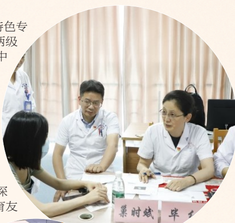
“巢博士”生殖工作室东台市中医院看诊现场

温情服务,擦亮“双友好”品牌。医院深入推进“儿童友好、生育友好”建设,把人文关怀融入诊疗全流程。生育友好方面,搭建从孕产到产后康复的闭环服务,开设产科特需门诊、LDRP家庭化产房,推行24小时无痛分娩、导乐陪伴,执行分娩费用“零负担”政策;儿童友好方面,以“一米高度”推进院区适儿化改造,开设儿童近视、肥胖、心理行为等特色门诊,成立儿童镇静中心,推行无假日服务,构建“防—筛—诊—治—康”全链条健康服务模式。一站式综合服务中心投入运行,集便民服务、医保服务、会诊转诊等八大功能于一体,实现“业务整合高效化、诊疗协同一体化”。患者满意度达97.45%，“医患同心、千群同心”的文化氛围在盐阜大地蔚然成风。