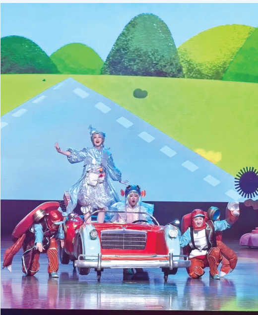
图为《江豚小星·奇妙归途》剧照