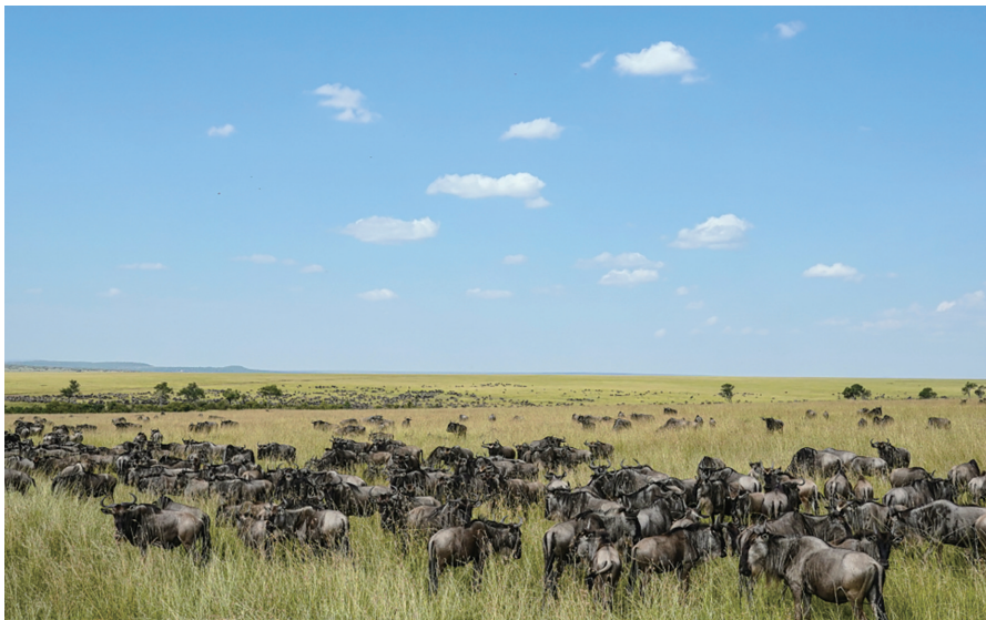
肯尼亚马赛马拉国家保护区,成群的角马在草原上觅食(2025年)。

山海相依,生态共鸣。盐城,这座让人打开心扉的城市,正以开放的姿态,热情邀约全球宾客到访探秘、沉浸式领略东方湿地的自然风光与人文魅力。