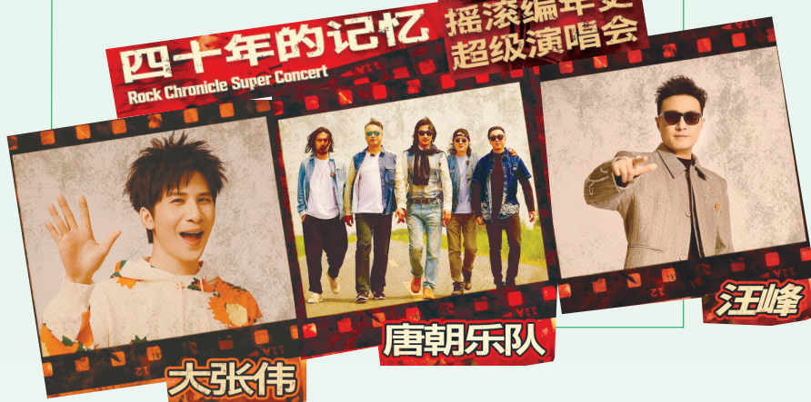
四十年的记忆 摇滚编年史 超级演唱会

同时,现场还将举办“丹顶鹤和Ta的朋友们”城市文旅IP展示、“好朋友草坪音乐会”、“NICE盐城·给朋友的礼物”文旅消费市集等多元活动,全方位呈现盐城湿地生态魅力与文旅融合成果。