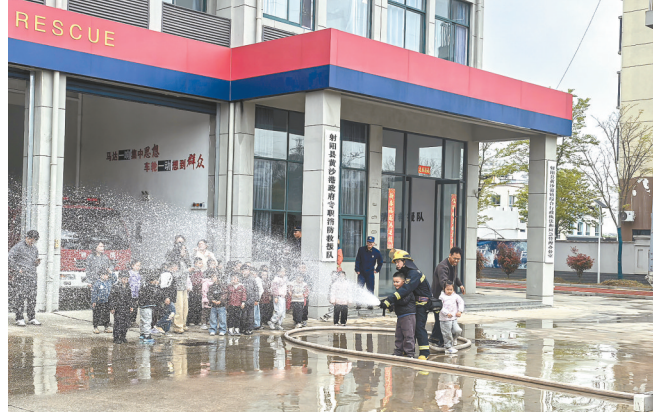
4月17日，射阳县黄沙港镇综合行政执法和应急管理办公室联合该镇专职消防队，举办消防站开放日活动，组织该镇幼儿园老师和小朋友们参观消防设备，亲身体验部分消防器材的使用。图为老师和小朋友们在消防站开放日活动现场。