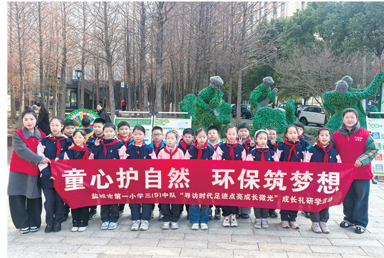
3月21日,市生活垃圾分类管理中心在盐南高新区垃圾分类主题公园,开展“垃圾分类践文明·成长有礼伴我行”宣传实践活动。盐城市第一小学数十名学生参与沉浸式研学,通过趣味游戏、知识问答等环节学习分类知识,参观废弃物为宝展品,并动手将旧物改造成创意作品。随后,孩子们化身“环保小宣传员”走进小区,向居民发放宣传册,普及分类知识,让学生在实践中树立环保意识,争做文明小先锋,传递绿色新风尚。

此次跨区域、长距离、高效率的海空联合救援,充分展现了盐城海上应急救援体系的快速反应能力与多方协作作战水平,为海上遇险人员生命安全筑牢坚实屏障。