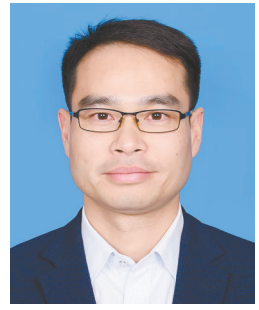
朱伟 亭湖区常委、区纪委书记、 区监委主任

亭湖区纪委监委牢牢把握政治机关的职责定位，精准聚焦服务保障的切入点和着力点，以高质量监督办案为高质量发展大局注入强劲“廉动力”。