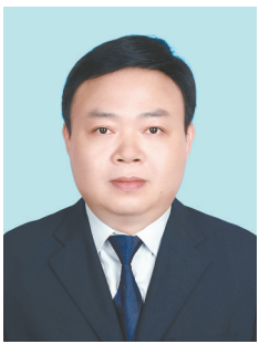
陈剑峰 阜宁县委常委、县纪委书记、 县监委主任

八届市纪委六次全会为今年纪检监察工作吹响了“冲锋号”。阜宁县委监委将认真落实市纪委全会精神，用好一体推进“不敢腐、不能腐、不想腐”这个战略抓手，贯通交好高质量办案、以案促改、以案促教“三张答卷”，不断增