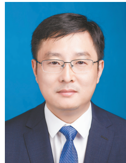
何国东 盐都区常委、区纪委书记、 区监委主任

盐都区纪委监委将坚决贯彻落实全会精神，并贯穿监督执纪全过程，实干争先、接续奋进，为“十五五”时期建设现代化“水韵古邑 高新盐都”提供坚强保障。