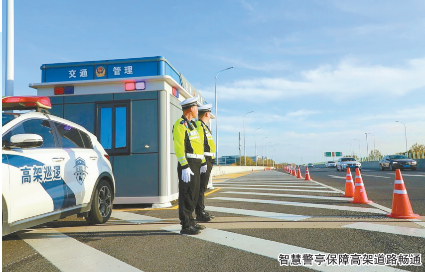
智慧警亭保障高架道路畅通

“苏超”、盐城市足球超级联赛、全国风筝邀请赛、“重走建军路”红色研学游……近年来,盐城各类文旅、赛事活动精彩纷呈,不断点燃城市热情,消费市场热气腾腾、活力奔涌。在这背后,始终有一抹抹“藏蓝”坚守一线,盐城公安从活动安保、交通疏导到维护市场秩序,全面发力,为消费市场注入“安全动能”。