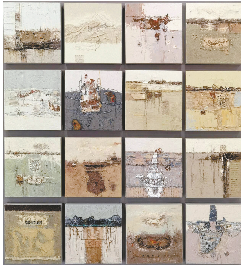
《忆》薛勇 油画 190×190cm

本次展览是省文联专门为“文艺两新”打造的艺术盛会,共展出美术、书法、摄影、民间工艺四大艺术门类新文艺群体精品力作100件。我市薛勇、曹琴、戚晓云的作品参展。