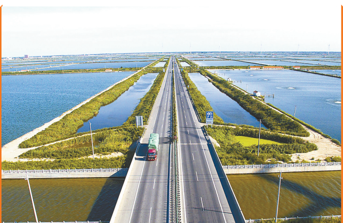
生态化水产养殖基地