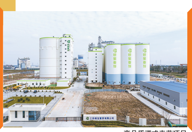
高品质塔式麦芽项目