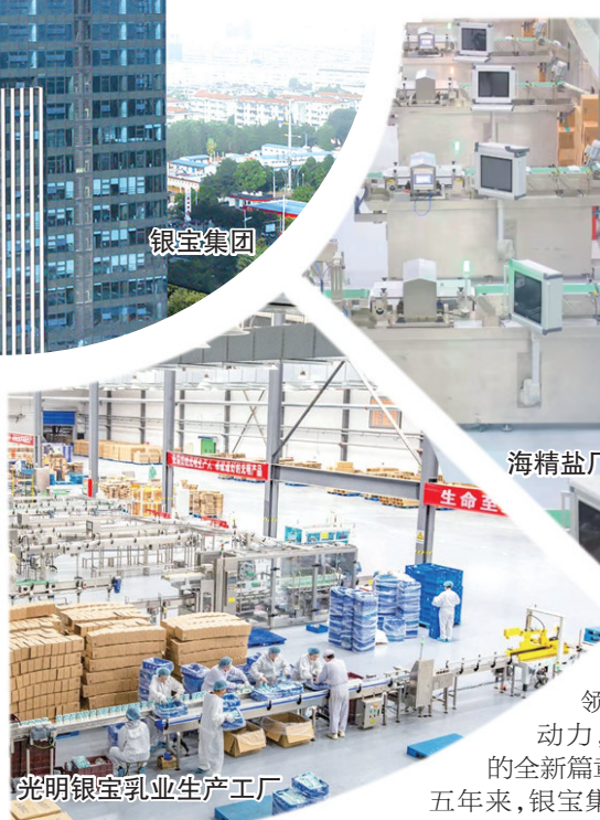
海精盐厂数字化工厂