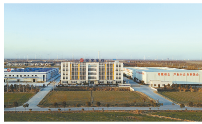
银宝菊花科技有限公司