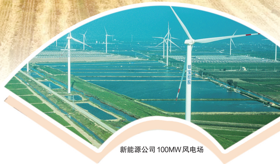
新能源公司100MW风电场