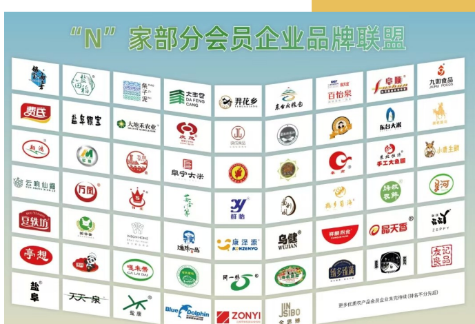
“N”家部分会员企业品牌联盟