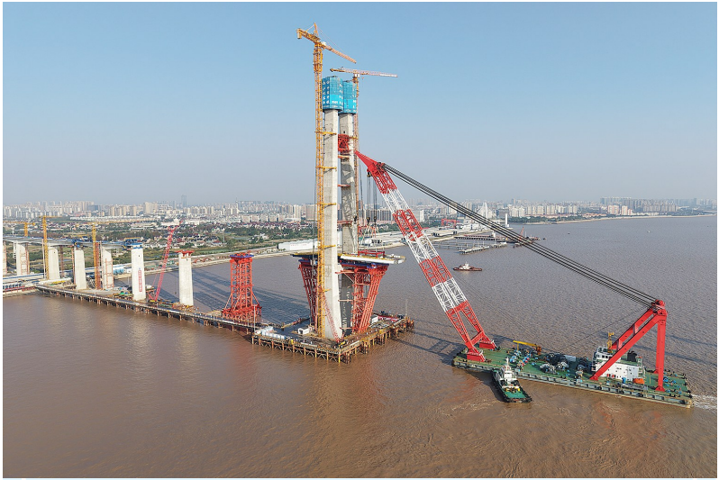
11月15日,在浙江杭州湾海盐侧离岸约0.4公里的海面上,重达626吨的钢梁在浮吊船的吊装下,精准架设到8号主墩上,标志着由沪杭客专公司建设管理、中铁大桥局承建的杭州湾跨海铁路桥北航道桥钢梁开始架设,桥梁正式进入上部结构施工阶段。