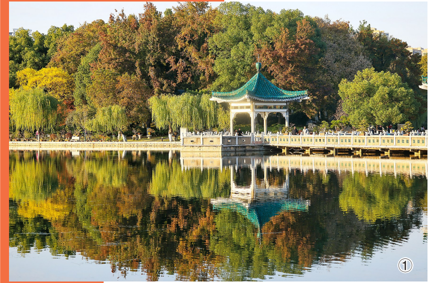
初冬时节,各地色彩斑斓,美景如画。

者、讲解员等。这就需要凝聚全社会力量,通过特色鲜明的研学课程、专业能力和素养高的研学导师队伍、服务优质的研学示范基地、具有公信力和影响力的研学认证体系,构建一套全链条、标准化、可复制的科普研学体系,形成具有全球影响力的“盐城模式”,让盐城黄海湿地不仅成为自然遗产的守护地,更成为生态文明的教育课堂。