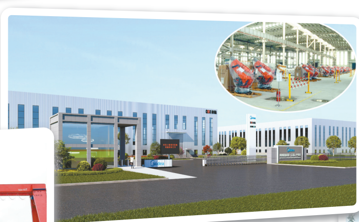
打造“三位一体”能源产业基地——美的能源科技