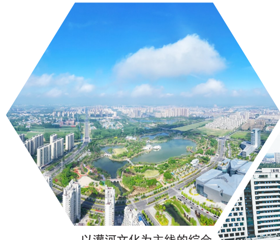
以灌河文化为主线的综合性景观——响水东明湖公园