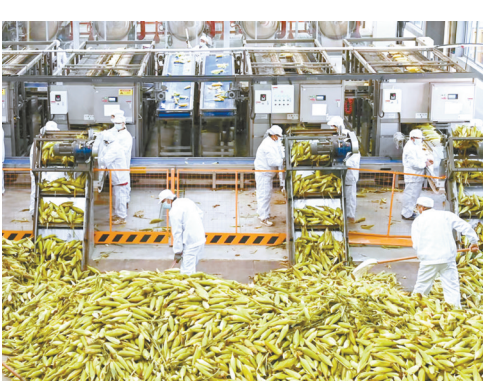
黄河故道富民特色产业——鲜食玉米加工