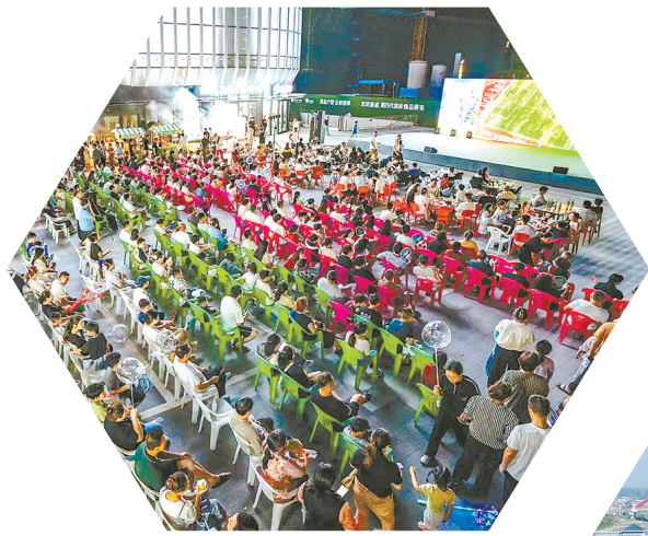
人气爆棚的“苏超”第二现场

面朝大海,逐梦未来。响水正以绿色转型为笔,以实干争先为墨,在推进中国式现代化响水新实践中,以永不懈怠的精神状态和一往无前的奋斗姿态,全力书写高质量发展的崭新篇章。