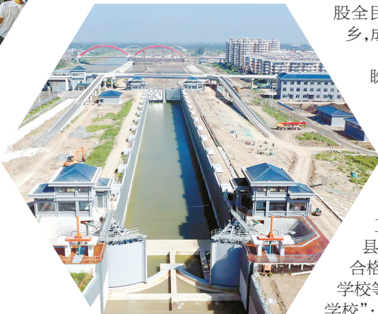
省水运重点工程——连申线淮河至黄响河段航道整治工程