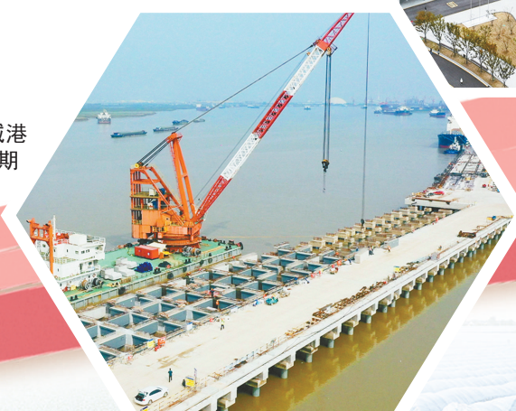
市重大建设项目——盐城港响水港区小蟮牛作业区码头二期