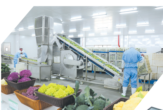
西兰花出口加工企业——万银食品

瞄准“药食同源”赛道,做好“石斛+”文章。在千亩铁皮石斛基地烘干车间,一朵朵石斛花被精包装礼盒,发