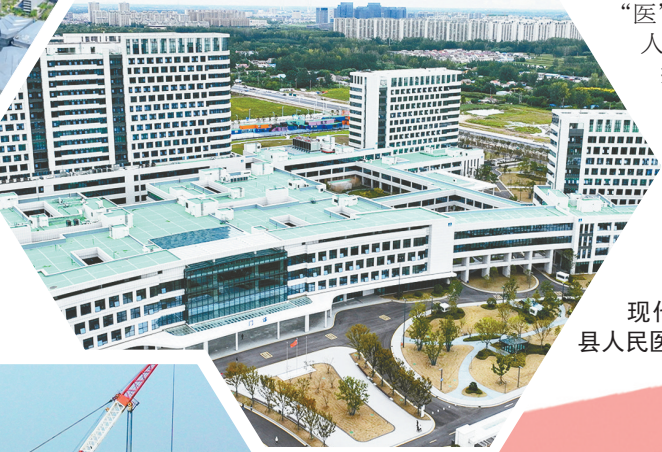
现代化医疗综合体——响水县人民医院新院区