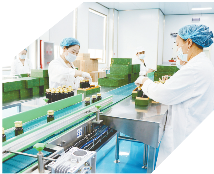
全省规模最大的铁皮石斛全产业链车间

“踏”绿前行,逐梦低碳,生态环保与工业生产相得益彰。“绿色”浓度不断提升,呈现集群式“绿向生长”,以坚实步伐推进低零碳园区建设。