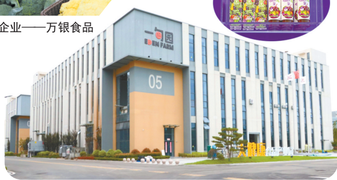
大健康食品产业——甸园NFC果汁项目