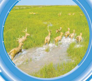
文字:程玉娇 陈加健

农业产业向“甜蜜”转型。5000亩连片甜蜜产业园沿344国道铺展,八里村甜瓜产业基地、特色农产品交易市场建设聚力“农特产品+旅游”的联动发展;与省农垦集团合作的盆果盆栽项目、与国企合作菌菇种植项目顺利推进。东台大粮仓八里集市场、西瓜分拣中心投产运营,推动“弇港甜”品牌走向华东。