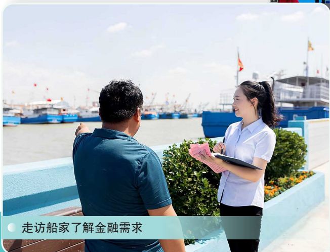
走访船家了解金融需求