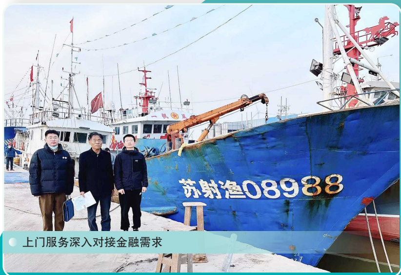
上门服务深入对接金融需求