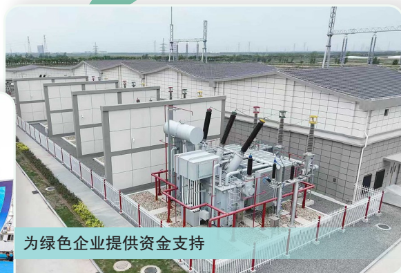
为绿色企业提供资金支持

源源不断的金融动能,有力推动盐城港实现跨越式、高质量的发展,在新时代的海洋经济发展浪潮中展现出蓬勃的生机与活力。