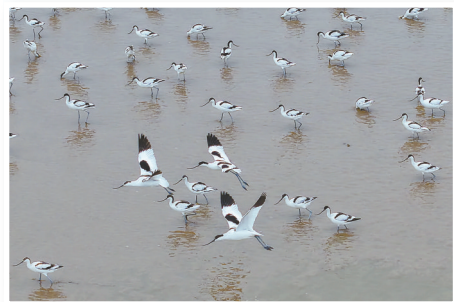
条子泥 齐鲁晚报 王鑫