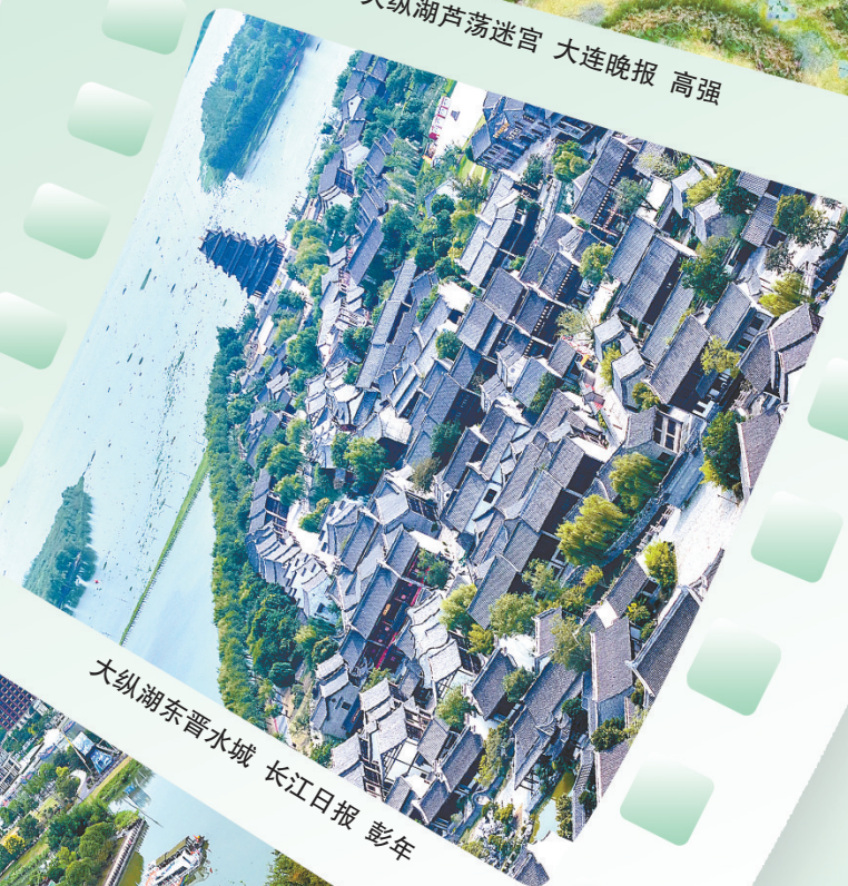
大纵湖东晋水城