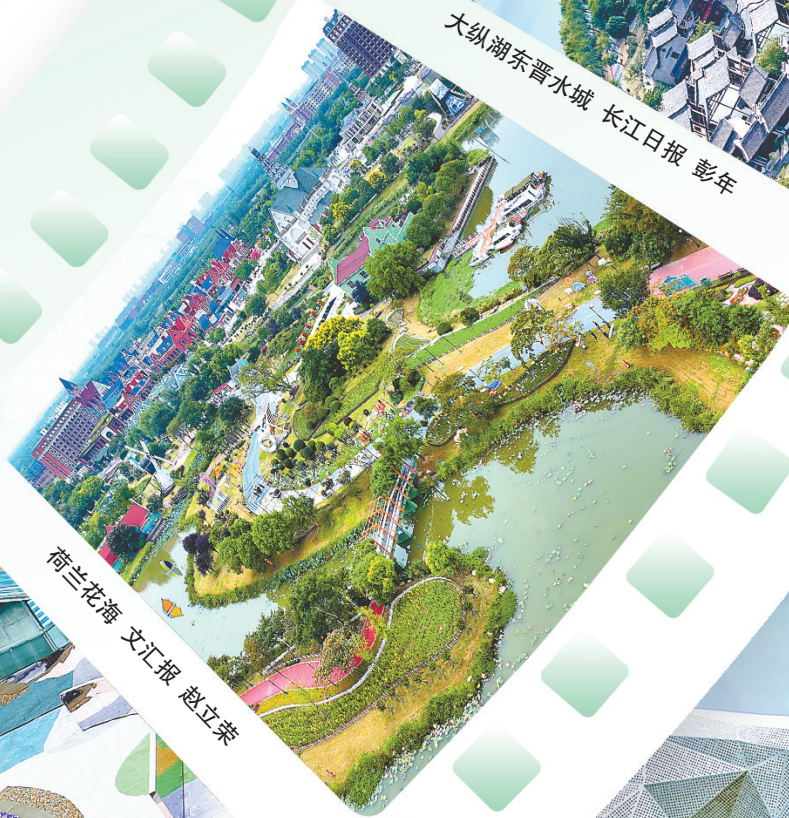
荷兰花海 文汇报 赵立荣