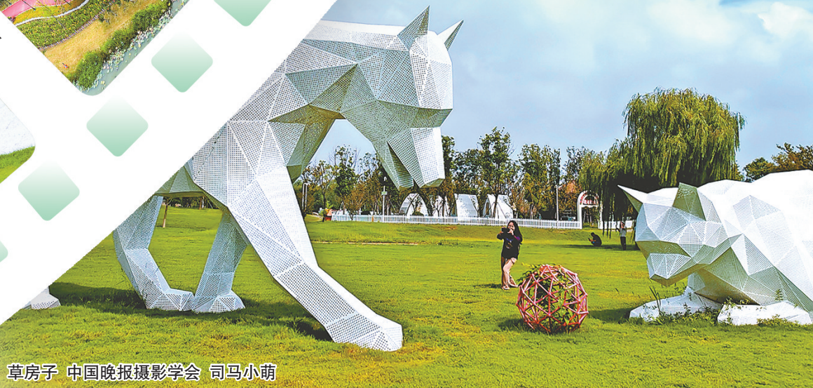
草房子 中国晚报摄影学会 司马小萌