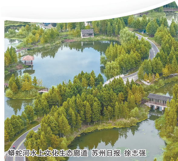
蟒蛇河水上文化生态廊道 苏州日报 徐志强