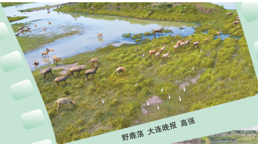
野鹿荡 大连晚报 高强