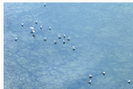
条子泥 南京日报 孟勃翰

在以“美丽滨海：生态优先 绿色发展”为主题的全球滨海论坛即将开幕之际，盐城向全国发出绿色邀约。9月12日至16日，由市委网信办、市文化广电和旅游局与盐阜大众报业集团联合主办的“飞阅湿地 守护世遗”全国湿地城市媒体航拍活动在盐城举行。来自全国15个城市的媒体代表深入盐城航拍采风，开启了一场非同寻常的生态发现之旅，用镜头飞阅盐城黄海湿地，在云端触摸生态脉搏。