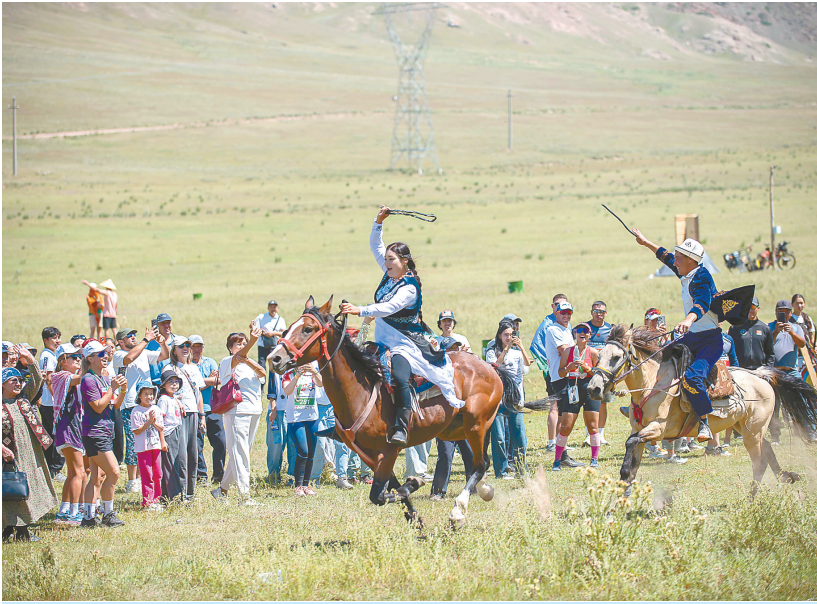
这是8月10日在吉尔吉斯斯坦伊塞克湖南岸举行的生态文化艺术节上拍摄的骑马追逐游戏。 此次艺术节在8月9日和10日举行,包括学术交流、民俗展示、山地赛跑等活动,旨在引起人们对珍稀动物保护和生态旅游发展的关注。