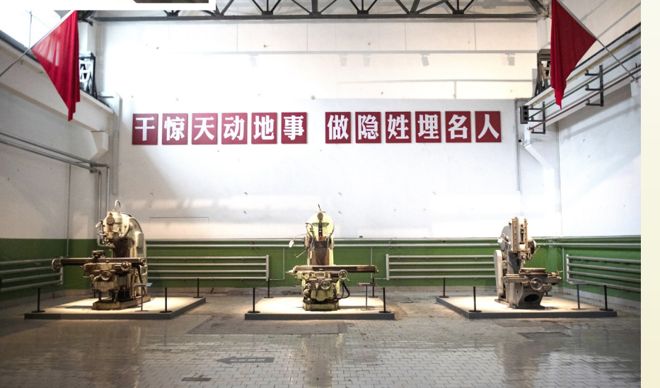
▲ 7月24日在青海省海北藏族自治州海晏县的青海原子城纪念馆拍摄的中国第一颗机载原子弹模型。