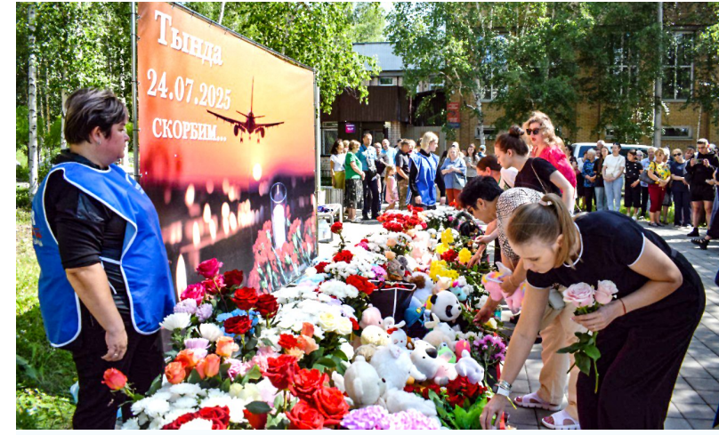
一架由俄罗斯安加拉航空公司运营的安-24客机24日在阿穆尔州滕达市坠毁,机上43名乘客和6名机组人员全部遇难。这架客机从远东城市哈巴罗夫斯克起飞,经停布拉文维申斯克飞往滕达市。俄罗斯阿穆尔州和哈巴罗夫斯克边疆区从25日起为安-24客机失事遇难者哀悼三天。 图为7月25日,人们在俄罗斯阿穆尔州滕达市悼念客机失事遇难者。

俄罗斯航空署正与交通监管部门合作调查失事客机所属航司。 一架由俄罗斯安加拉航空公司执飞的安-24型客机24日在阿穆尔州境内坠毁,机上人员全部遇难。