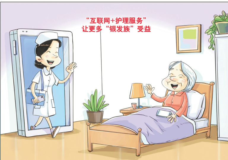
便民举措 新华社发 王鹏 作