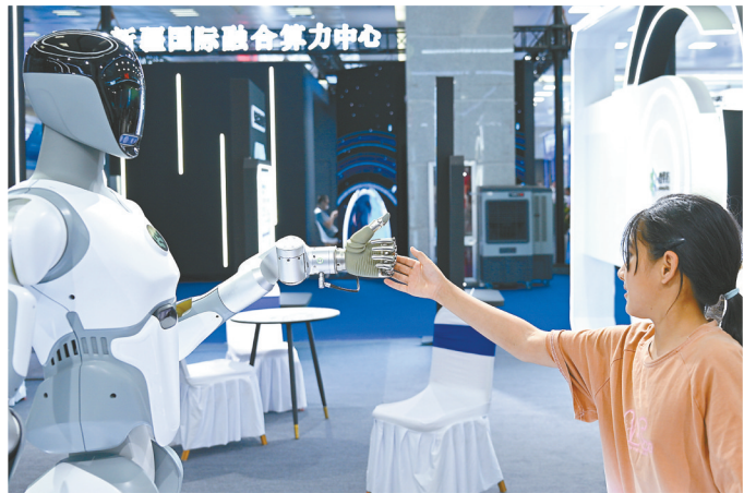
◀ 观众与一款通用智能机器人互动。

6月26日,以“共商亚欧合作 共享丝路繁荣”为主题的2025(中国)亚欧商品贸易博览会在新疆国际会展中心开幕。本届商博会为期5天,将举办60余场境内外贸易投资促进专项活动,涉及产业对接洽谈及成果发布、招商引资推介等。