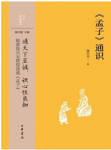
《《孟子》通识》 徐兴无 著 中华书局