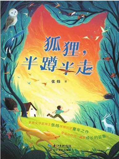
《狐狸，半蹲半走》 张炜 著 长江文艺出版社