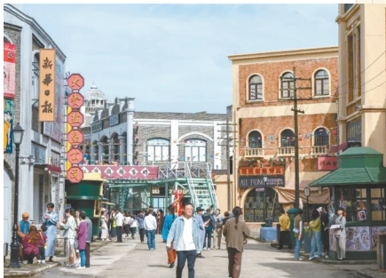
燕舞(大纵湖)剧工厂