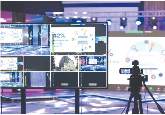
长三角数字视听产业基地