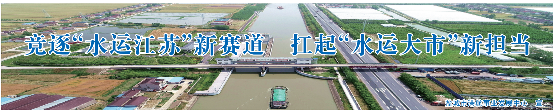
盐城市港航事业发展中心 宣