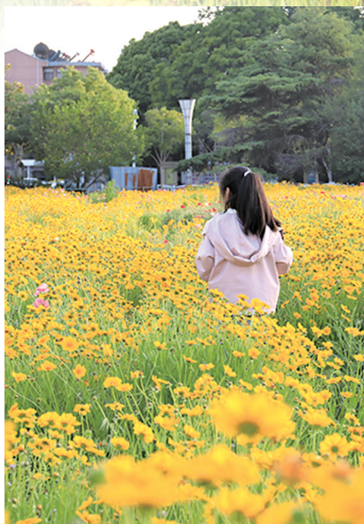
孩童在“花海”中游玩