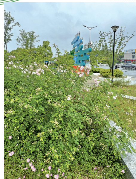
建军路与希望大道节点东南角