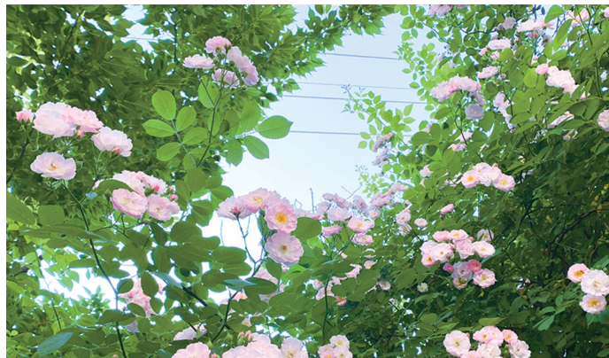
盐城市第一小学一角