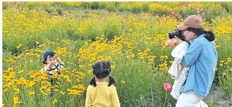
市民在“花海”中留影

这令人陶醉的生态景观,是我市推进城市“微更新”的生动缩影。近年来,我市聚焦城市闲置地块,实施拆围建绿工程,通过对闲置地块进行草坪覆绿、播种观赏花卉,让城市“边角地”变身“后花园”,同步配套建设停车场、疏导点等便民服务设施,并对围挡外围进行美化升级,这些细致入微的“微更新”举措,不仅有效改善了城市环境,更提升了市民生活的幸福感和获得感,为市民打造集休憩、观赏于一体的高品质城市空间,让城市发展更有温度、更具质感。