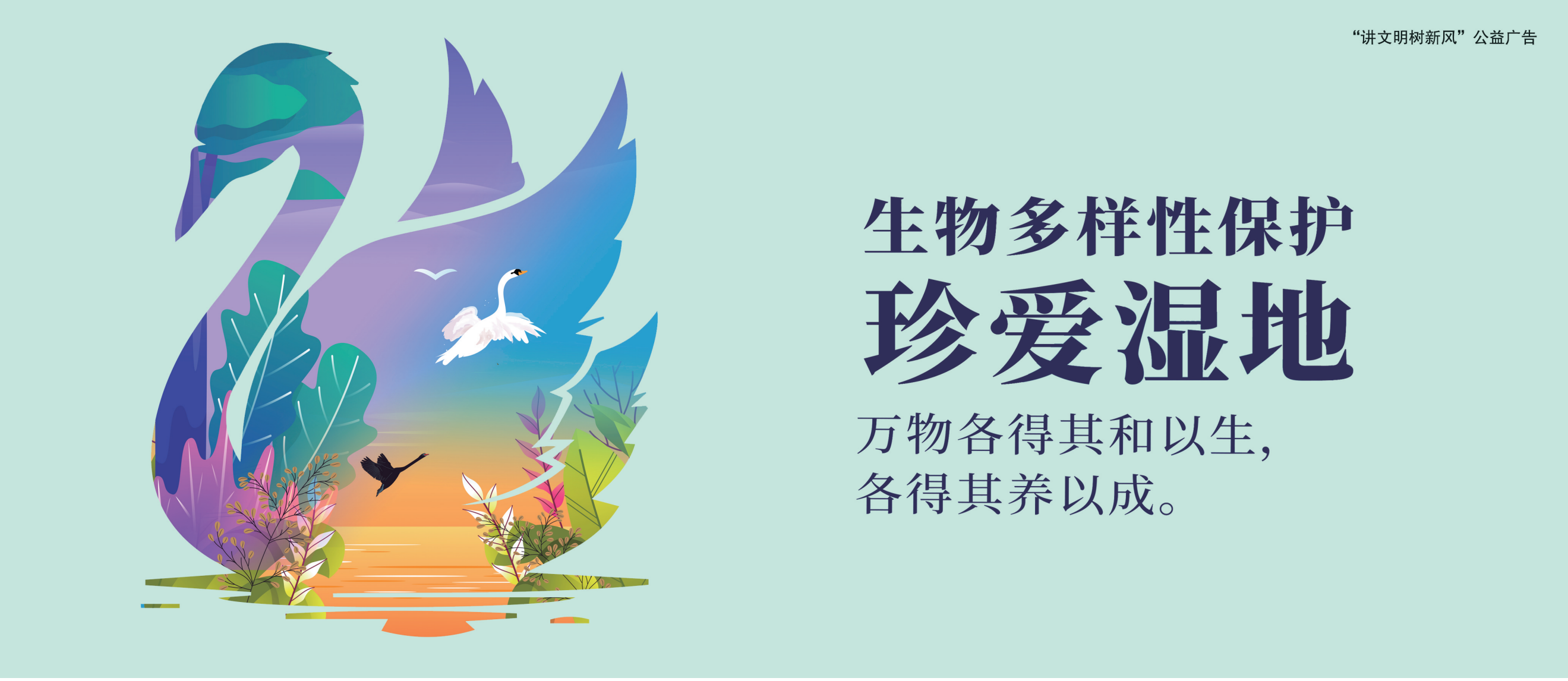
“讲文明树新风”公益广告