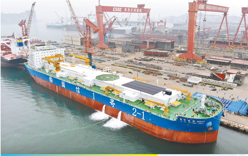
靠泊在中国船舶集团北海造船厂码头的大型养殖工船“国信1号2-1”（4月17日摄，无人机照片）。

当日，全球首艘15万吨级智慧渔业大型养殖工船“国信1号2-1”在位于山东青岛的中国船舶集团北海造船厂交付。据了解，“国信1号2-1”将以“船载舱养”模式开展大黄鱼、鲢鳙鱼等名优鱼种养殖，设计年产高品质鱼类约3600吨。