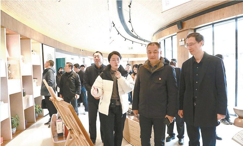
参观现场