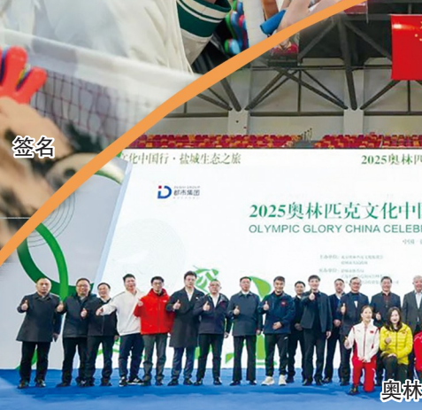
签名 2025奥林匹克文化中国行·盐城生态之旅 2025 OLYMPIC GLORY CHINA CELEBRITY TOUR · 2025 YANCHENG 奥林匹克文化中国行·盐城生态之旅盛大开幕