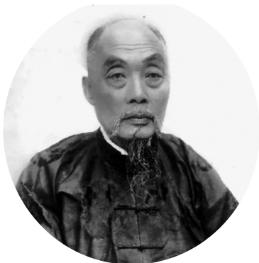
张謇(1853年~1926年),清末状元,中国近代实业家、政治家、教育家,主张“实业救国”。

两年后,张謇更是从围海造田、改良盐土技术在全球都享有盛誉的荷兰聘请了一位年轻而才华横溢的水利专家亨利克·特莱克,来帮助规划农田水利工程。