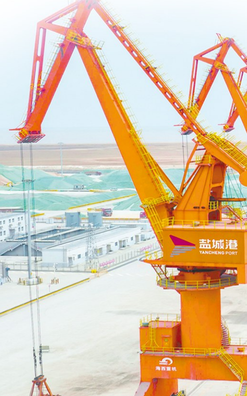
“五星工程奖”戏曲门类

多方联合,开展走访核查。建湖县纪委监委建立多方会商研判机制,会同财政、民政、广电等部门,吃穿穿透低保户困难群众电视相关政策文件,强化综合分析,以省纪委监委交办问题线索所涉镇为重点,联合该镇纪委成立工作专班,针对问题线索涉及的困难群体基数较大、居住分散等特点,综合运用实地走访、个别访谈、查阅资料等一线工作法,由纪检监察干部会同村(居)干部逐一入户开展走访摸排,核